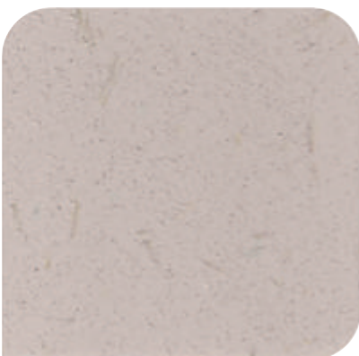
XDC - M18 (100g)