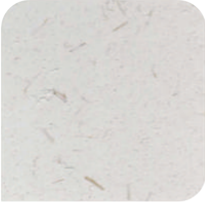
XDC - 基料