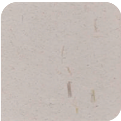
XDC - M31 (100g)